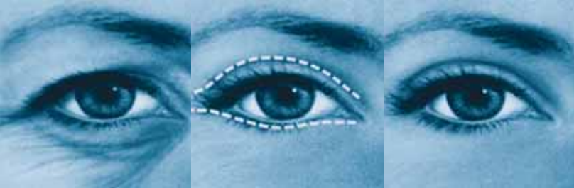
Nach der OP sieht das Auge jünger und freundlicher aus