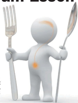
Die Zusammenhänge zwischen Kopf und Magen beim Essen zeigt ein neues Buch.

»Hunger & Lust – Das erste Buch zur Kulinarischen Körperintelligenz«, Uwe Knop, ISBN 978-3-8370-5296-1, 156 Seiten, 13,80 Euro, books on demand