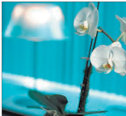
Kurzsichtigkeit (Bild oben) und Weitsichtigkeit (Bild unten) können durch die »Add-On-Linse« ausgeglichen werden. So können Patienten nach einer Katarakt-OP ein brillenfreies Leben führen.